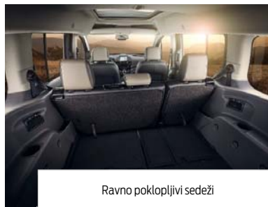
Ravno poklopljivi sedeži