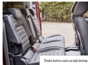
Široka bočna vrata za lažji dostop