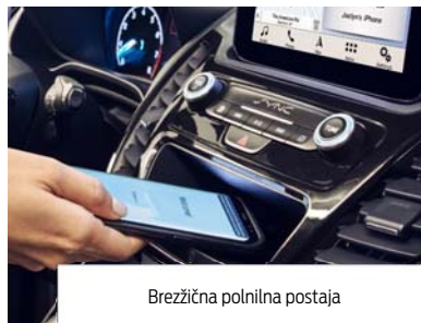
Brezžična polnilna postaja