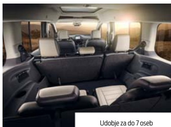
Udobje za do 7 oseb