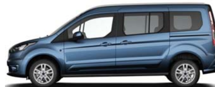
Grand Tourneo Connect