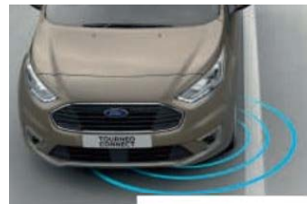
Pomoč pri vzdrževanju smeri (LKA)