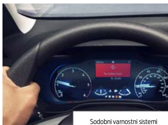
Sodobni varnostni sistemi