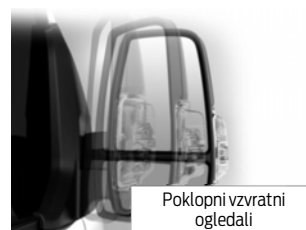
Poklopni vzratni ogledali