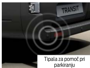
Tipala za pomoč pri parkiranju