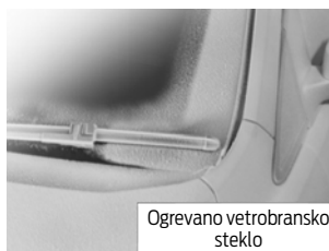
Ogrevano vetrobransko steklo