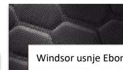
Windsor usnje Ebony