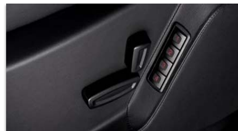
Električno nastavljivi sedeži s spominsko funkcijo