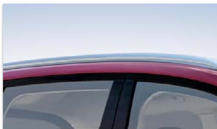
Vzdolžna strešna nosilca