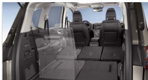
Elektro-mehanskega podiranje sedežev 'Easy Fold Flat'