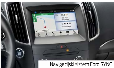
Navigacijski sistem Ford SYNC