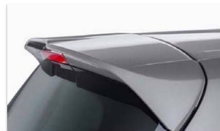
Velik zadnji strešni spojler