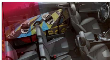
Sedeža v tretji vrsti