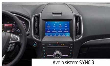
Avdio sistem SYNC 3