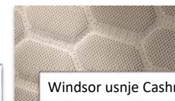
Windsor usnje Cashmere